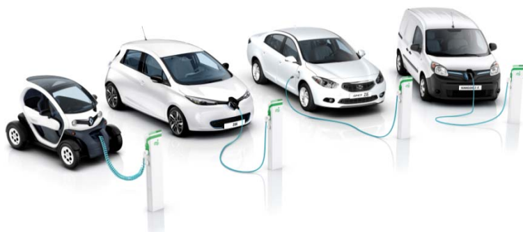
Véhicules électriques du groupe Renault

À noter : les études d'Analyse du Cycle de Vie menées par Renault montrent que, sur l'ensemble du cycle de vie du véhicule en Europe, un véhicule électrique permet de réduire quasiment de moitié les impacts globaux sur l'environnement, dont le réchauffement climatique, par rapport au véhicule thermique équivalent.