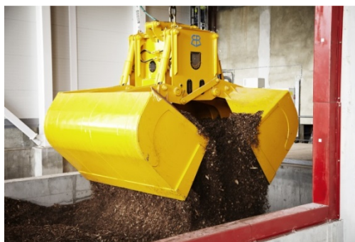
Combustible végétal pour l'alimentation des chaudières biomasse, usine de Tanger

Autre exemple, dans une démarche de progrès continu cette fois, l'usine de Sandouville réduit ses consommations de gaz naturel en s'approvisionnant, depuis 2012, en vapeur produite à partir de déchets industriels.