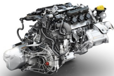
Moteur Energy TCe 90

En 2013, le groupe Renault a bénéficié en année pleine des ventes de modèles renouvelés courant 2012.