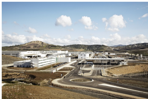
Usine Renault de Tanger, Maroc

Inaugurée en 2012 et pilotée par Renault, elle se veut devenir l'usine « Zéro émission de carbone » de l'Alliance Renault-Nissan. À Tanger, Renault met en œuvre des équipements permettant de réduire les besoins en énergies et des technologies de production d'énergie thermique générant peu de gaz à d'effet de serre, en partenariat avec le Royaume du Maroc et Veolia Environnement.