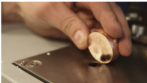
Cuivre issu du recyclage de véhicules hors d'usage

Grâce à cette démarche, Renault a par exemple intégré deux nouvelles références de plastiques issus du recyclage en boucle courte dans son catalogue de matières plastiques (Panel Matières Renault), en 2014.