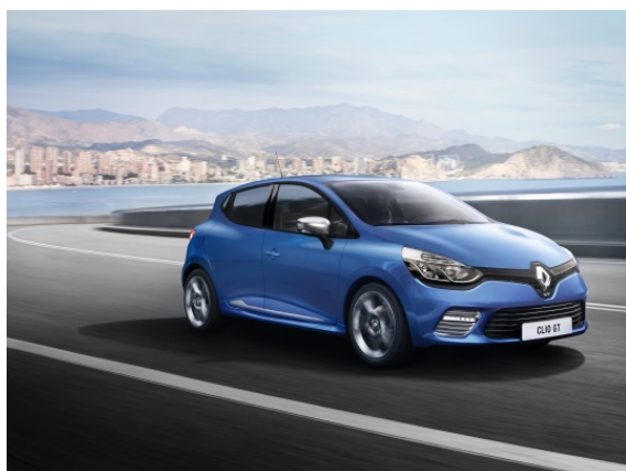
Renault Clio IV Berline GT

Les nouveaux modèles commercialisés en 2013 s'inscrivent dans cette dynamique. Captur , équipé du moteur diesel Energy dCi 90, présente des émissions homologuées à 95 g CO 2 /km, et à 113 g CO 2 /km avec le moteur essence Energy TCe 90. Nouvelle Logan MCV affiche pour sa part les mêmes performances que Nouvelle Sandero et Nouvelle Logan.